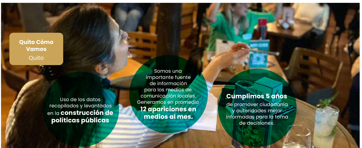
Taller de fortalecimiento de liderazgo de las mujeres en la política.

Inclusión de jóvenes y mujeres en la política Ecuador