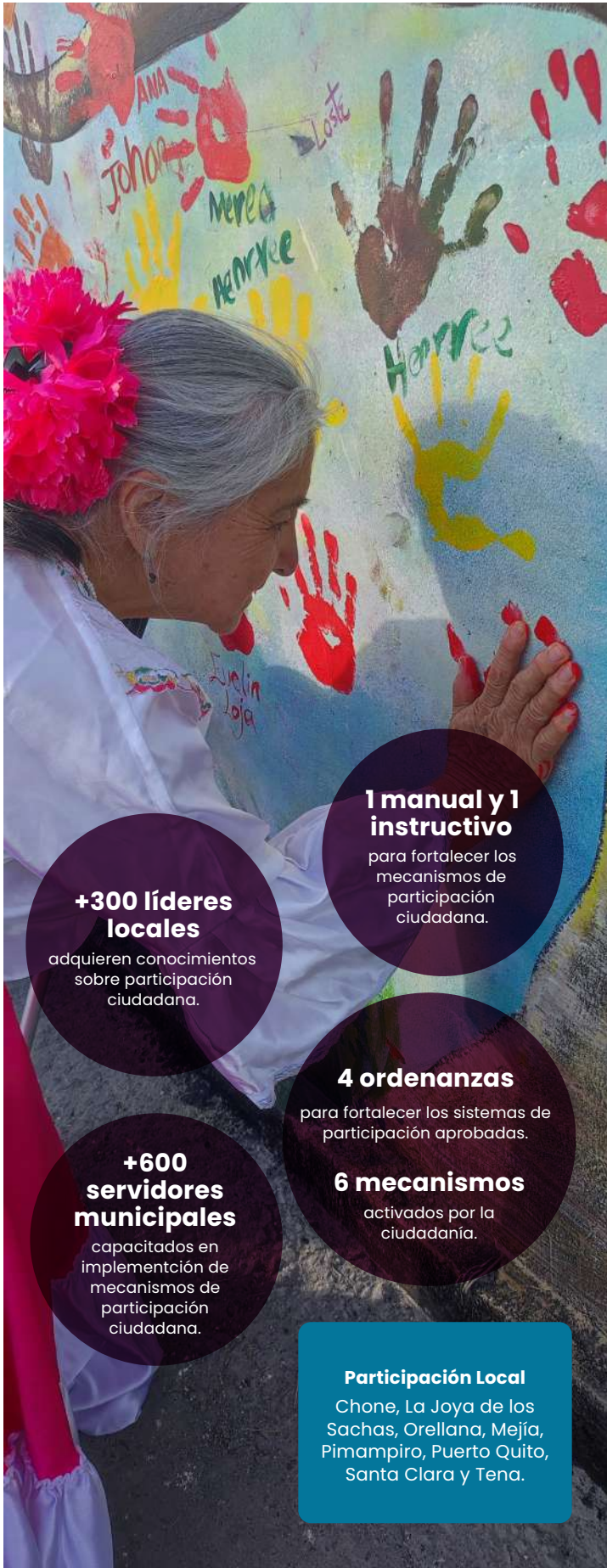
Intervención de urbanismo táctico, barrio San Juan de Calderón.