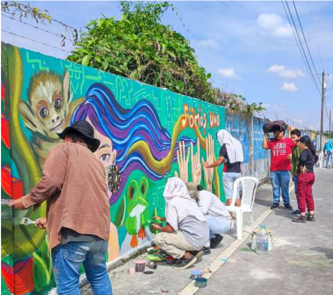
Intervención de acupuntura urbana en La Joya de los Sachas - Orellana