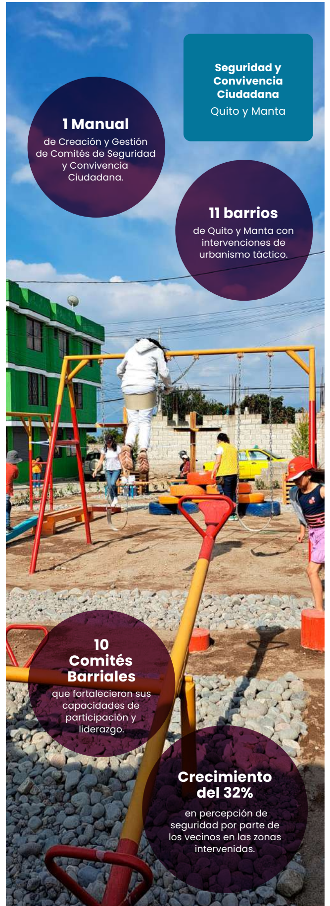
Participación de adultos mayores en Intervención de urbanismo táctico en Orellana.

Seguridad y Convivencia Ciudadana Quito y Manta